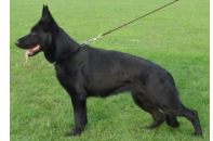
Eldorado vom Gräfental