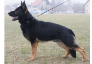
Dana von der Bismarcksäule's