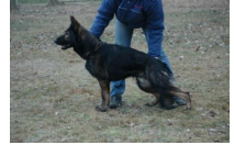
Askia von der Bismarcksäule