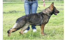
Ayko vom Ludwigseck